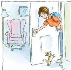
6. ...volvió a casa a las 5.00.