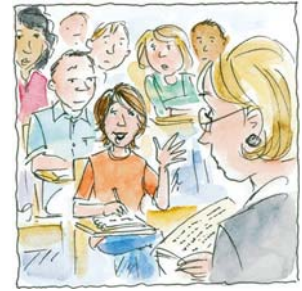
4. ...participó en clase.