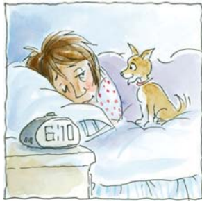
1. ...se levantó temprano.