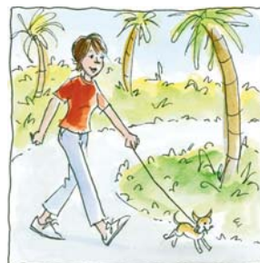
7. ...dio un paseo con su perro.