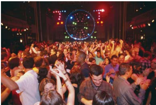
En una discoteca de Madrid

En España, México y otros países las discotecas suelen abrirse a a las 11.30 de la noche y se cierran a eso de b las 4.30 ó 5.00 de la mañana. En este país muchos clubes y discotecas se abren y se cierran más temprano.