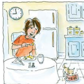
11. ...cenó tarde.