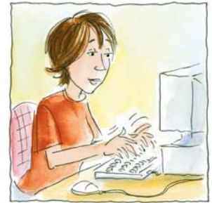
8. ...leyó su correo electrónico.