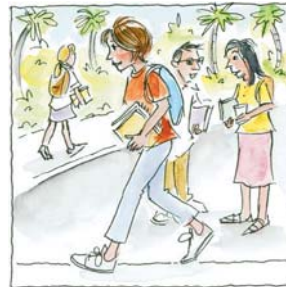
3. ...caminó a la universidad.