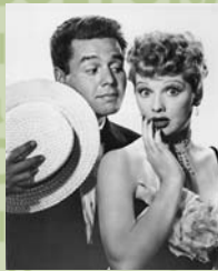
Desi Arnaz y Lucille Ball

Desi Arnaz fue la primera superestrella a latina? Aunque muchas personas de ascendencia latina como Jennifer López, Salma Hayek y Ricky Martin tienen gran fama hoy en día, el primer latino de gran fama en la música, el cine y la televisión de los Estados Unidos fue Desi Arnaz de la serie I Love Lucy .