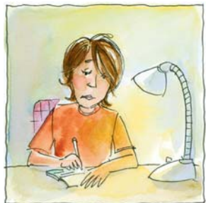
9. ...pagó unas cuentas.