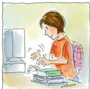
10. ...hizo su tarea.