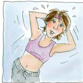
2. ...hizo ejercicio aeróbico.