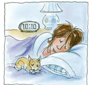
12. ...se acostó temprano.