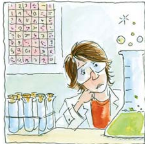
5. ...trabajó en el laboratorio por la tarde.