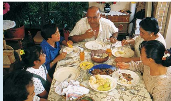
Un almuerzo típico en México

En los Estados Unidos y el Canadá el almuerzo típico es una comida rápida que dura entre 30 minutos y una hora. En muchos países hispanos, el almuerzo puede durar un par a de horas. La gente no se marcha b inmediatamente después de comer. Se queda un rato c para conversar con la familia.