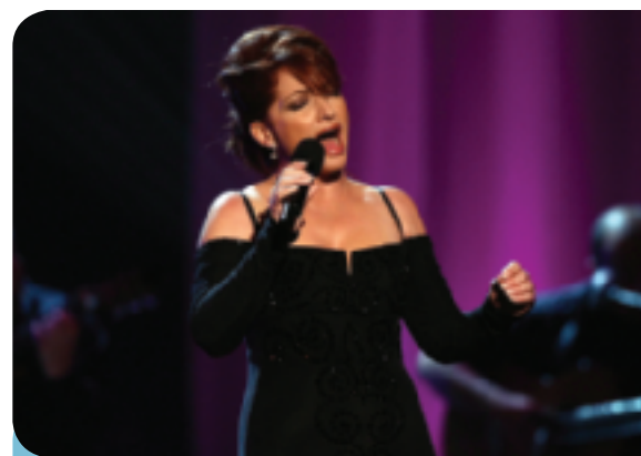
Gloria Estefan, en Los Ángeles, California