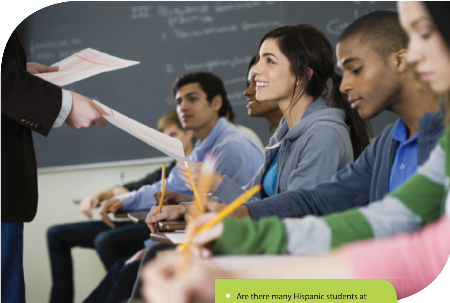
En un salón de clase universitario