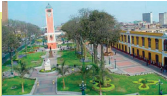
El campus de la Universidad de San Marcos, en Lima, Perú