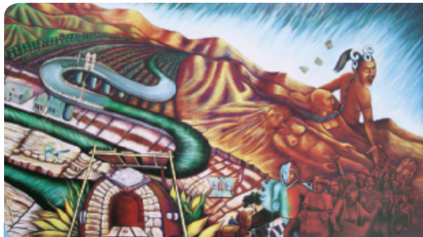
La memoria de nuestra tierra (our land), parte de un mural de Judith Baca

a These b cada... increasingly greater c tienda... small shop d Hispanic neighborhood