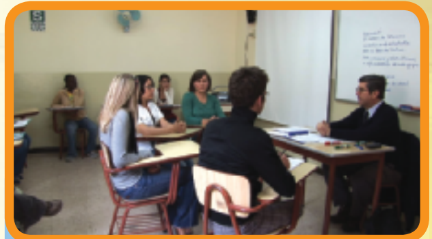
El Centro de Idiomas, una de las modernas instalaciones de la Universidad del Pacífico