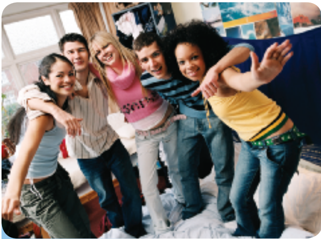
¿A Ud. le gustan las fiestas?

D. En una fiesta. The following paragraphs describe a party. First scan the paragraphs to get a general sense of their meaning. Then complete the paragraphs with the correct form of the numbered infinitives.