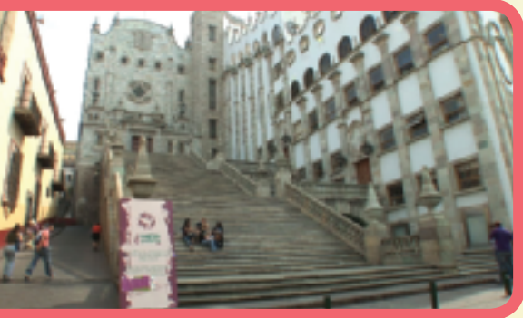
La Universidad de Guanajuato, México, fundada en 1744 (mil setecientos cuarenta y cuatro)