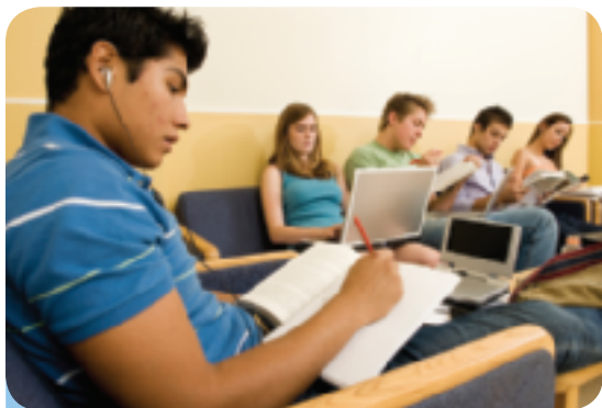
¿Dónde le gusta estudiar a usted?

Paso 1. Answer the following questions. Pay attention to the words and endings in bold—you have seen most of them before and should be able to guess what they mean.