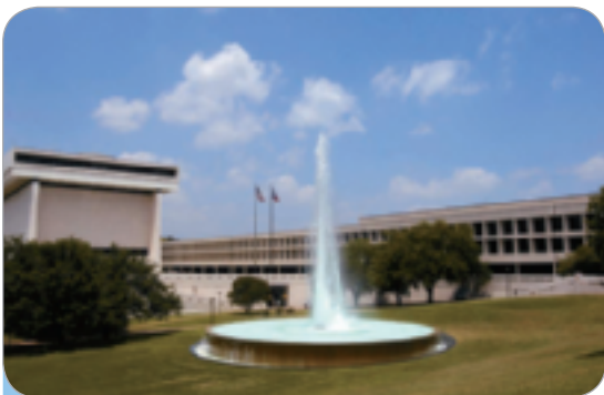
La Colección Latinoamericana Benson, una colección comprensiva de libros, documentos, revistas ( magazines ) y periódicos ( newspapers ) relacionados con ( related to ) Latinoamérica

B. Lengua y cultura: Dos universidades fabulosas... y diferentes. Complete the following description of two well-known universities. Give the correct form of the verbs in parentheses, as suggested by context. When the subject pronoun is in italics> , don't use it in the sentence. When two possibilities are given in parentheses, select the correct word.