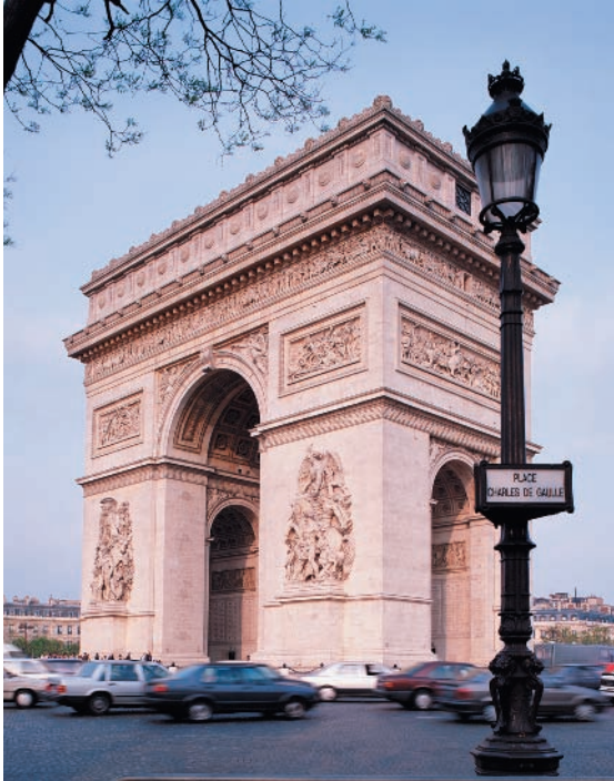
L'Arc de Triomphe, à Paris, en France